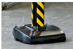
stabiler Standfuß auf Rollen