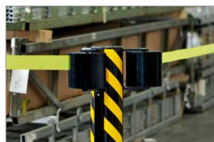
2 Gurte à 22 Meter