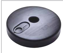
[2] rund aus Kunststoff, befüllbar