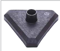
[1] dreieckig aus Kunststoff mit Beton gefüllt