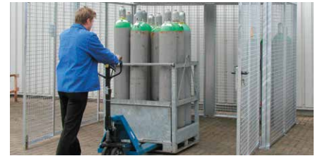
Gasflaschen-Paletten für den Staplertransport von bis zu 8 Gasflaschen auf Anfrage lieferbar.

entspricht den technischen Regeln Druckgase TRGS 510