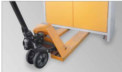
Leichter Transport: Mit Gabelhubwagen unterfahrbar.