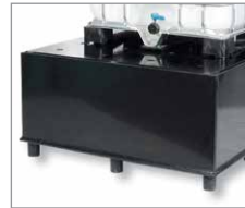
mit FüÙen und PE-Lochplatte, für IBC