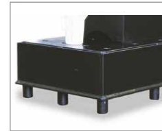
mit FüÙen und PE-Lochplatte