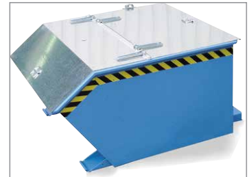
mit Deckel (Zubehör)