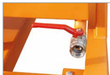
Ablasshahn 1" (bei Späne-Ausführung)