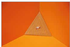
Siebblech (bei Späne-Ausführung)