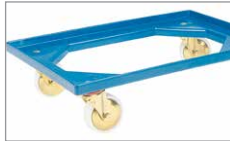
Transportroller 620 x 420 mm