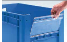
Sichtscheibe im Stapel zu öffnen