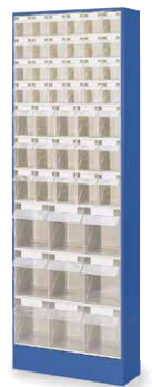
24 x A, 15 x B, 9 x D 880185