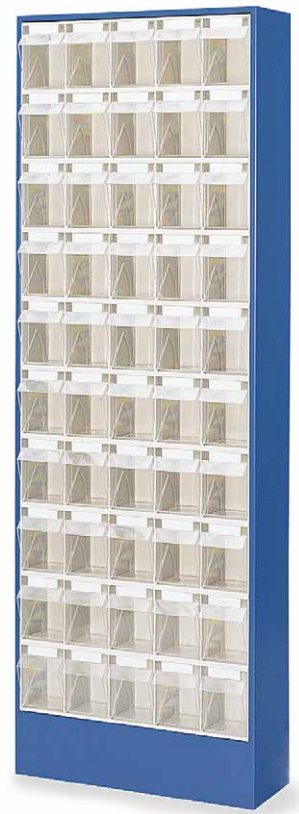
50 Kästen Größe B 100581