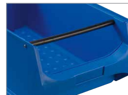
Größe [4] und [5] optional mit Tragestange

Hoch belastbare und formstabile Lagerboxen mit Noppenstruktur am Boxen-Innenboden für leichteste Entnahme von Kleinteilen.