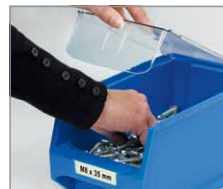
alle Boxen mit Staubdeckel und Etiketten ausrüstbar