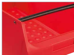
Noppenstruktur am Innenboden für leichte Kleinteile-Entnahme