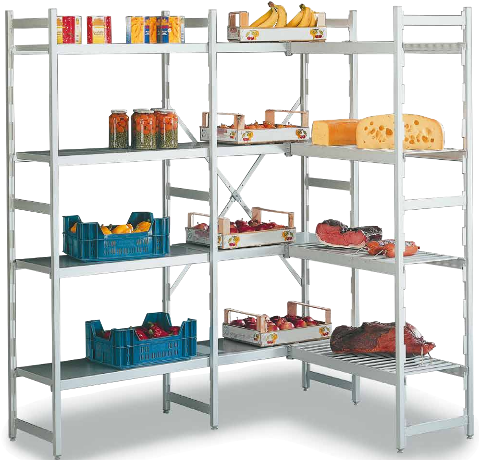
Abb. zeigt Ausführung Aluminium