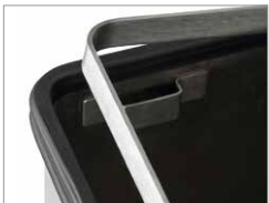
einfach bedienbare Müllsackhalterung