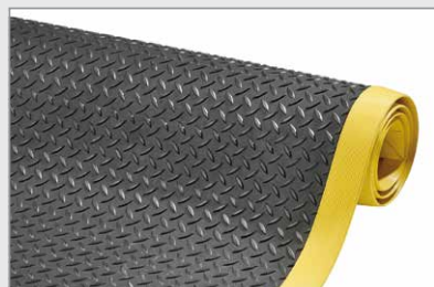
schwarz / gelb