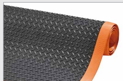
schwarz / orange