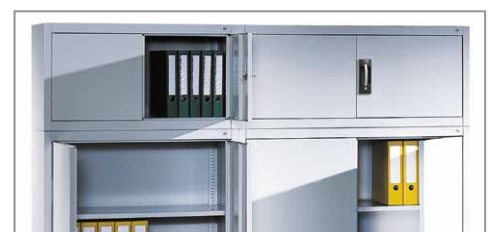
[5] mehr Stauraum durch Aufsatzschränke (inkl. Verschraubungsmaterial), Größen siehe Tabelle