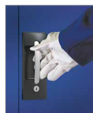
einfaches Öffnen auch mit Handschuhen