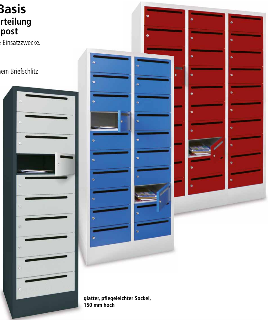
glatter, pflegeleichter Sockel, 150 mm hoch