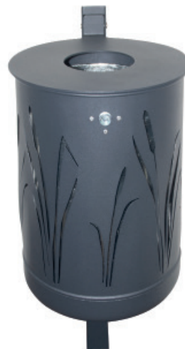
Abb.: 7039-60 in RAL 7021 feinstruktur