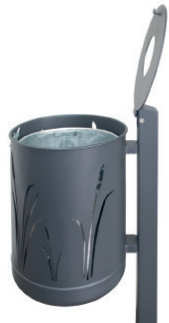
Abb.: 7039-60 in RAL 7021 feinstruktur geöffnet inkl. optionalem Einsatzbehälter 7039-01