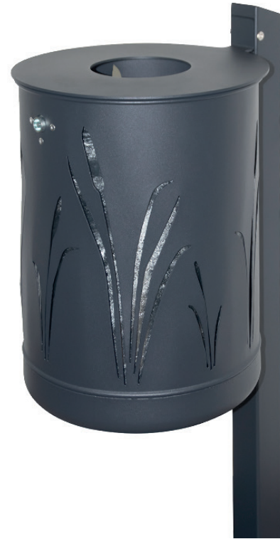
Abb.: 7039-60 in RAL 7021 feinstruktur